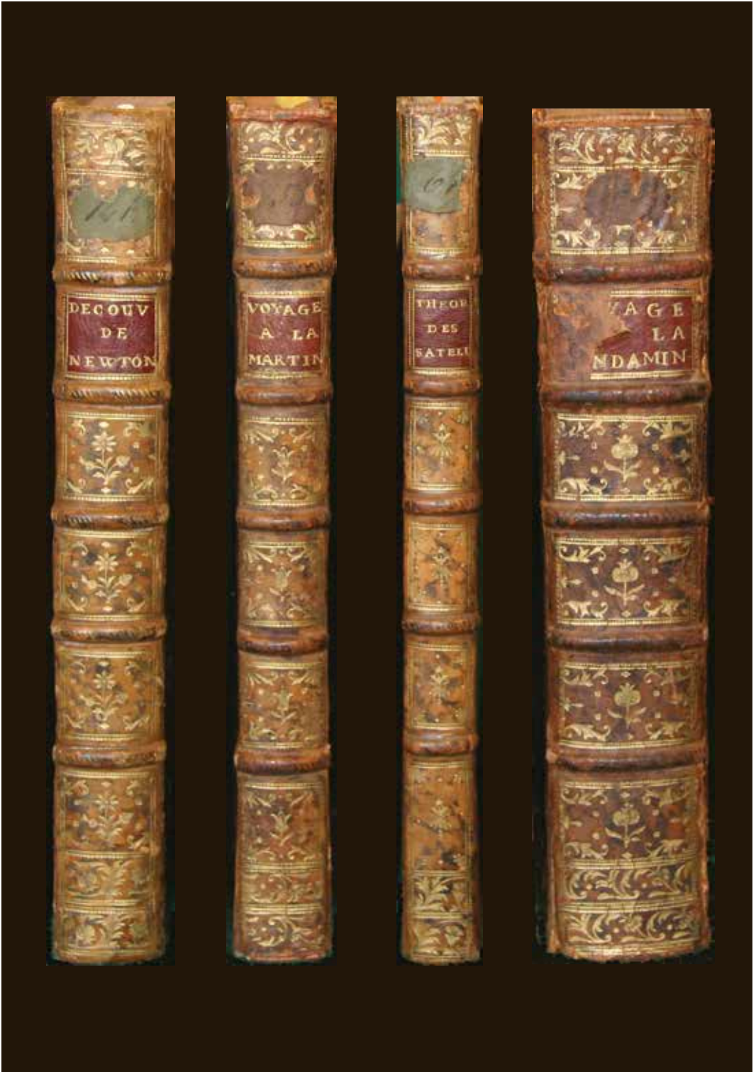
2. Reliures: 4C (n° 534); 4D (n° 155); 4E (n° 45); 4F (n° 463-466)