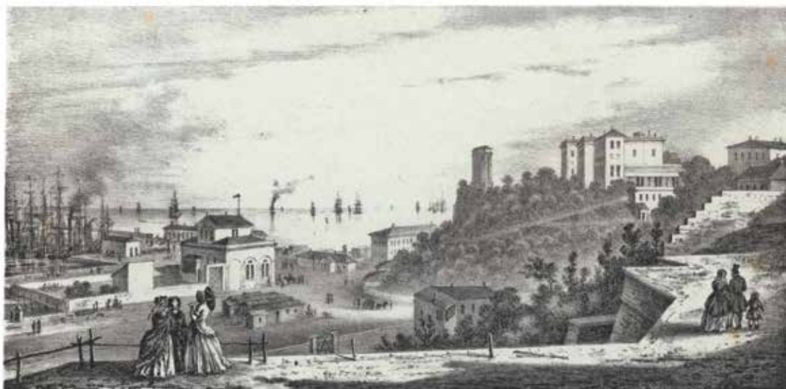
Odessa. Descente au port de pratique

2. « Plan d'Odessa en 1794 », Gabriel, marquis de Castelnau, Essai sur l'histoire ancienne et moderne de la Nouvelle Russie , Paris, 1820, t. III.